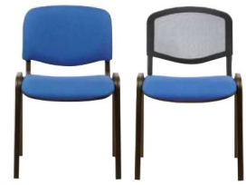
ISO & ISO'R P.189